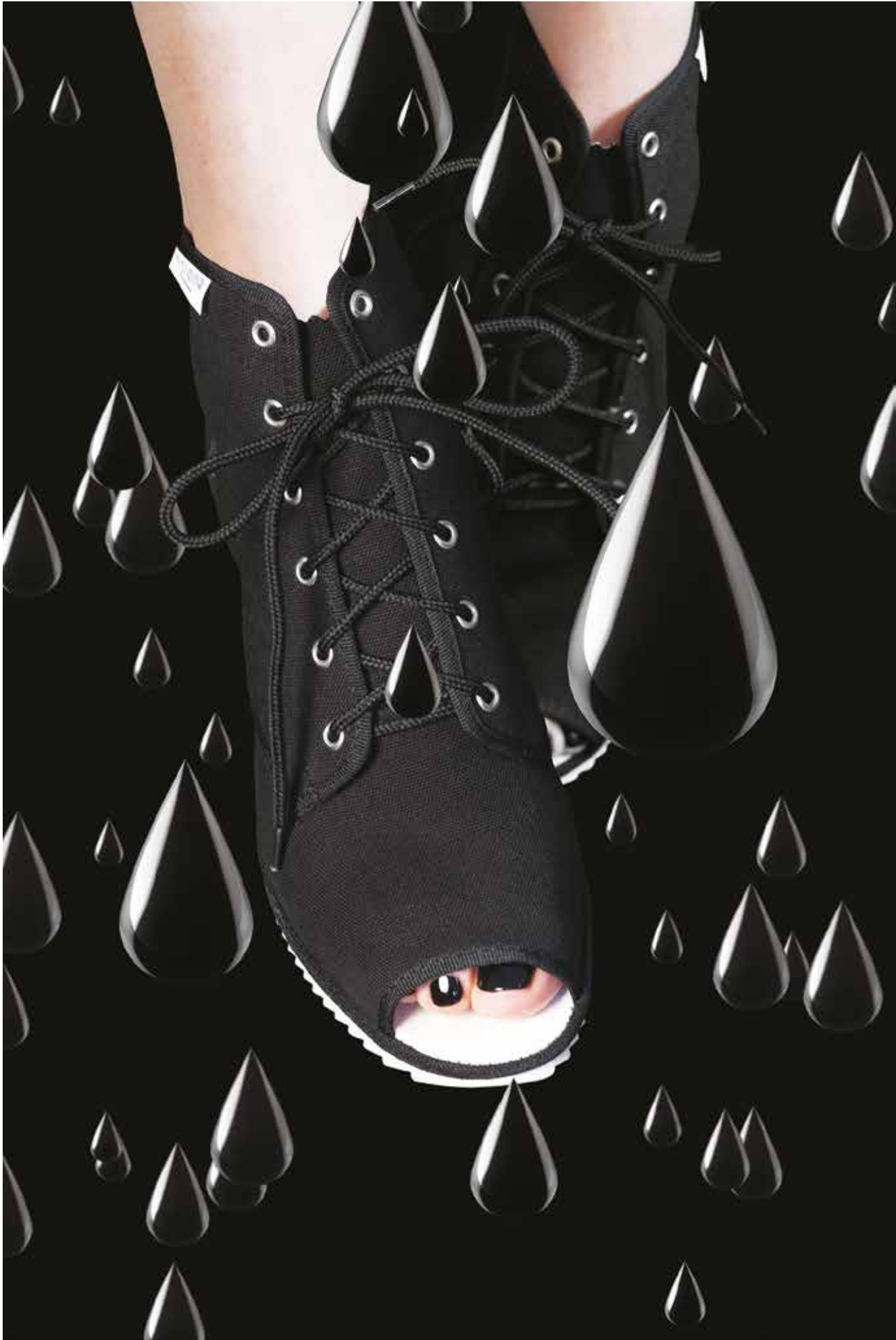
Nine Hour Delay , introduction poster, 2013.