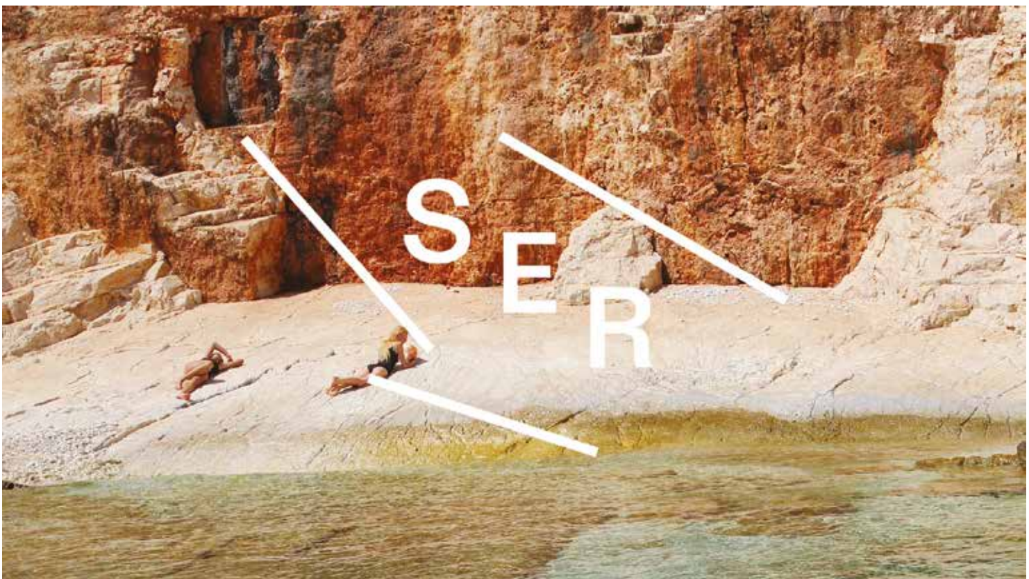
Below - SER TV Spot (still), 2015. Special thanks to the Fiorucci Art Trust.