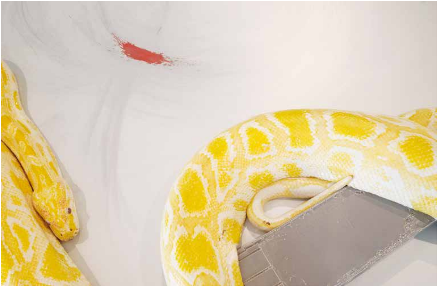
Above - Night of the World (detail), 2013.